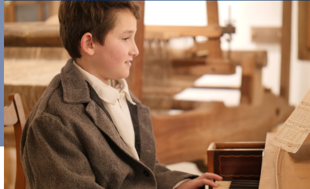
Der junge Franz Xaver Gruber am Klavier.