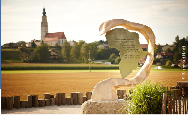
Eine der kunstvollen Skulpturen: Afrika