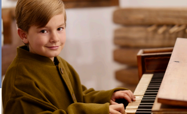
Der junge Franz Xaver Gruber am Klavier.