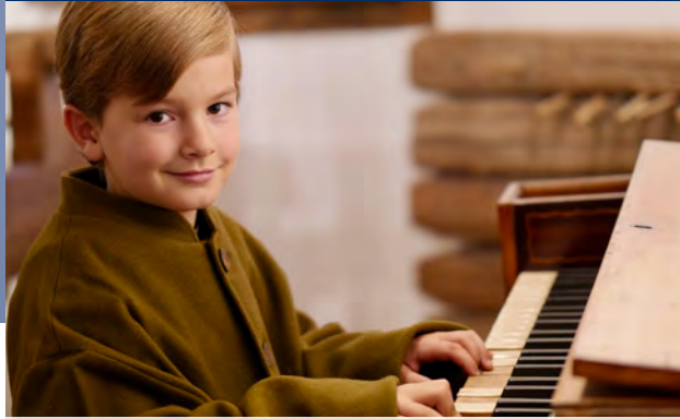
Der junge Franz Xaver Gruber am Klavier.